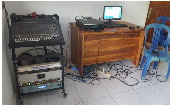
Radio Povo Viqueque live vanuit Dilor, Lacluta.